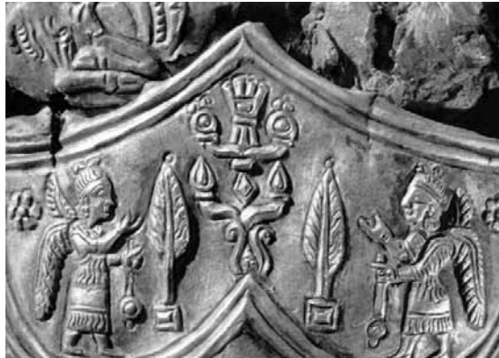
A kettős kereszt az ősi szkíta jelképeken figyelemre méltó lényegi összefüggésben áll a Világfával

biológiájában megfogalmazott életelv minden lényeges tulajdonsága, kozmikus jellege és az élet felemelő és értelemszerű, az egész Világegyetemben összhangot teremtő volta révén azonosítható az ősi eurázsiai civilizációban ismert életelvvvel. Ez a tény pedig azt jelzi, hogy az ősi eurázsiai civilizáció szellemi téren meghaladta a modern nyugati civilizáció látóhatárát és megismerőképességének mélységét.