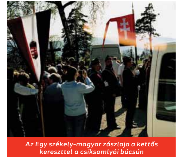
Az Egy székel-magyar zászlaja a kettős kereszttel a csíksomlyói búcsún

Ez az ősi tudás a kozmikus alapelvekről a modern tudomány négy évszázados fejlődésének köszönhetően az anyagi világ terén tudományosan beigazolódott. A modern fizika legnagyobb vívmánya