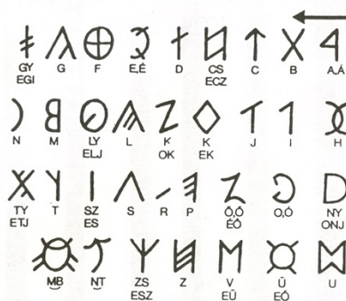
81. A rovásnaptár ábécéje a Marsigli által megjelölt hangértékkel

A Világfa, az Életfa és a Tudás Fája jelképeinek egysége, és közös elemük, a „fa” élő volta egyaránt megerősíti, hogy ez a legmagasabb jelentőségű tudásrendszer lehetett a kettős kereszt rendkívüli, jelképes erejének eredeti forrása. Újabb, ezúttal kettős egyezés, hogy a magyar rovásírásban az Egy jele éppen három vonalból áll, és ez éppen a kettős kereszt. Ezzel újabb ősi elem bukkant fel utunkon, ezúttal egyértelműen a magyar őstudomány újabb kiemelkedő jelentőségű jelképe.