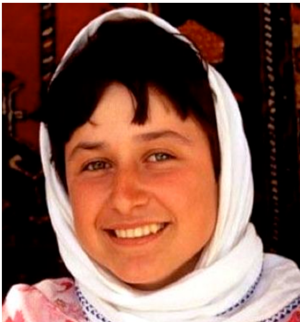
2. kép. Turánid embertípusba tartozó lány.

típusúnak nevezett lakossággal, mert ami keleti vér volt benne ezer év előtt, azt már régen elveszítette a sokszoros vérvesztés és sokirányú rasszkeveredés következtében. Ezt a véleményt alátámasztani látszott az a megfigyelés, hogy hazánkban a lakosság túlnyomó többsége éppúgy rövidfejű, mint a többi középeurópai államban. Bartucz hozzáteszi: „ A rendszeres antropológiai vizsgálatok s a jellegeknek korrelációs tanulmányozása azonban e véleményt hamar megdöntötte. Kiderült, hogy ez a nagygyakoriságú és egységesnek hitt rövidfejű csoport tulajdonképpen hatféle koponyaalakot rejt magában. A rövidfejűek nagy része ugyanis csak mérsékelt rövidfejű s nem barna, hanem világos színű (kelet-europid rassz), de a barna rövidfejűek közül is egy rész a nyakszirt lapossága és az arc keskenysége által (dinári rassz), más része a hátsó koponya szélességével (turánid rassz), ismét más része a homlok rézsútosságával (taurid rassz) tűnik ki, egy részén pedig határozott mongoloid vonások észlelhetők. Így azután körülbelül csak 10-15% olyan rövidfejű marad, akin az alpi rassz jellegzetes bélyege, a gömbölyű körvonalú agykoponya és arc felismerhető ” (Bartucz Lajos: A magyar nép. 1943, 54.o.).