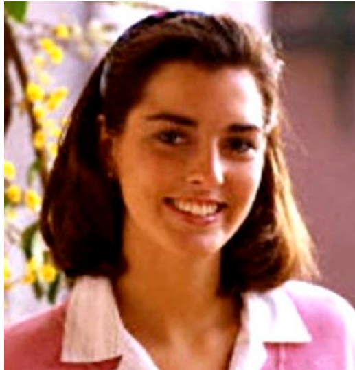
3. kép. Gracilis mediterrán nő.