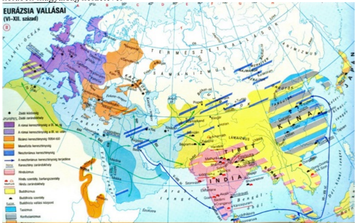
2. kép: Eurázsia vallásai, i.u. 6.-i.u.12. század. A természetvallások körzete csökkent